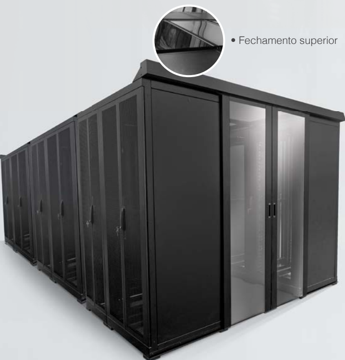
SISTEMA DE CORREDOR DE TÚNEL FRIO